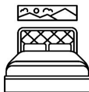
ハウスキーピング